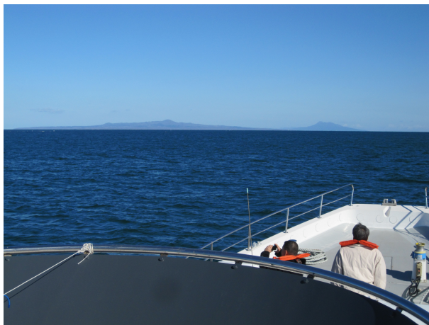
船上から国後島を望む

10月28日から31日までの3泊4日、「北方領土返還要求滋賀県民会議」主催の第32回北方領土視察団として参加させていただきました。当初参加する前は北方領土の対岸から「返せ」と勇ましくシュプレキコールを発する事のイメージがありましたが、この研修では、領土問題の奥深さ、約70年を経過した現実などを考えますと、北方領土問題解決への難しさがひしひしと伝わった4日間でもありました。